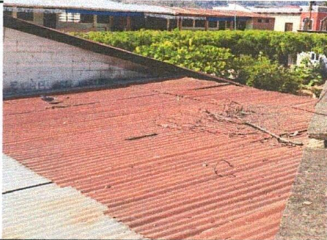
Foto 5: área de cocina, parte superior, Sustitución de lámina, por lámina troquelada aluzinc calibre 26.