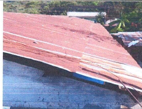
Foto 4: parte superior, edificio 2, Sustitución de lámina, por lámina troquelada aluzinc calibre 26.