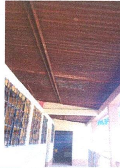
Foto 2: parte interna, edificio 1, Sustitución de lámina, por lámina troquelada aluzinc calibre 26.