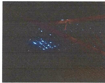
Foto 6: área de cocina, parte interna, Sustitución de lámina, por lámina troquelada aluzinc calibre 26.

Observación: Si es necesario se pueden agregar hojas adicionales y actualizar el número de hojas.