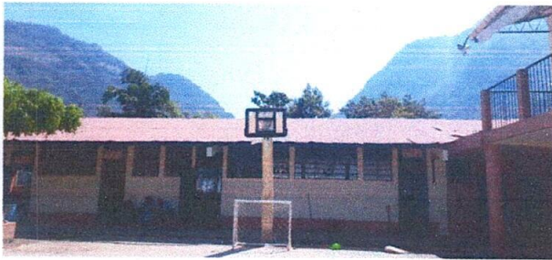
Foto 3: parte frontal, edificio 2, Sustitución de lámina, por lámina troquelada aluzinc calibre 26.