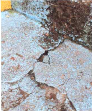
Foto1: Reparación de banquetas de concreto