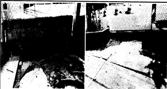
Foto 5: MURO PERIMETRAL: reparación de muro de block con tubo hg y malla galvanizada, soleras intermedias y columnas.