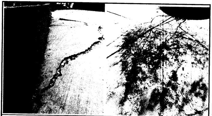
Foto 4: LOSA DE PATIO: Planchas de concreto del patio exterior en mal estado por undimiento y deterioro..