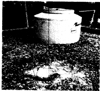
Foto 3: RED DE AGUA POTABLE: sustitución de depósitos de agua de 400 lt. por uno de 1,100 lt.