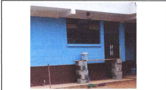
Foto1: Pinturas en interiores y exteriores