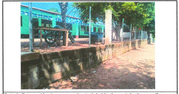
Foto 6: Reparación de muro perimetral de block con tubo hg y malla galvanizada, soleras intermedias y columnas.

Observación: Si es necesario se pueden agregar hojas adicionales y actualizar el número de hojas.