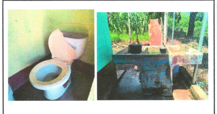
Foto 4: Sustrucción de 3 inodoro y sus accesorios completo, 3 lavamanos y una pila de concreto.