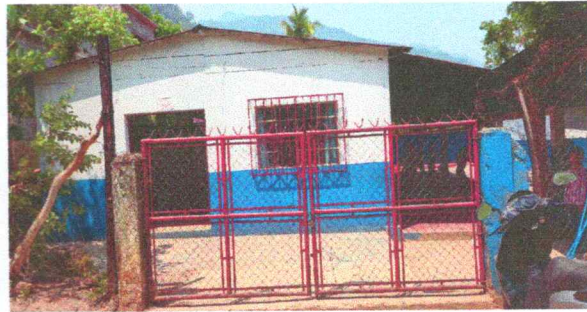
Foto 2: Levantado de techo Por estar demasiado bajo y cambio de malla en porton por estar deteriorada.