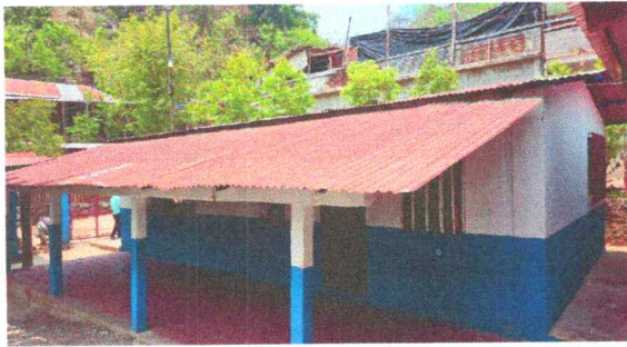
Foto 1: Cambio de lámina y estructura de madera por estar en mal estado.