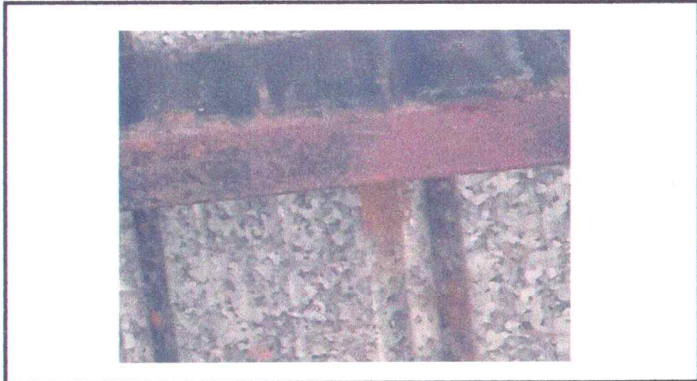
Foto1: Sustrucción de estructura de soporte de metal