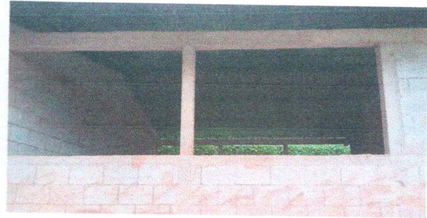
Foto 2: Sustitución de balcones, estructura de ventanas, vidrio, balcones