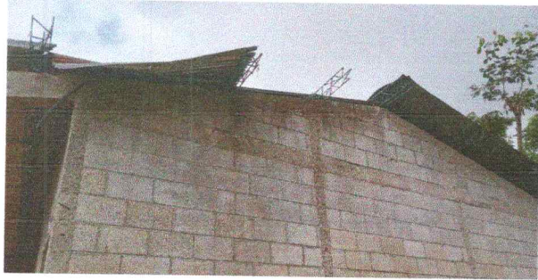
Foto1: Sustitución de lámina por lámina troquelada