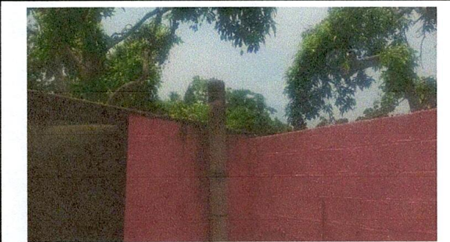
Foto 2: EL TECHO DE LA COCINA YA HA SIDO DESMONTADO PARA SU NUEVA INSTALACIÓN.