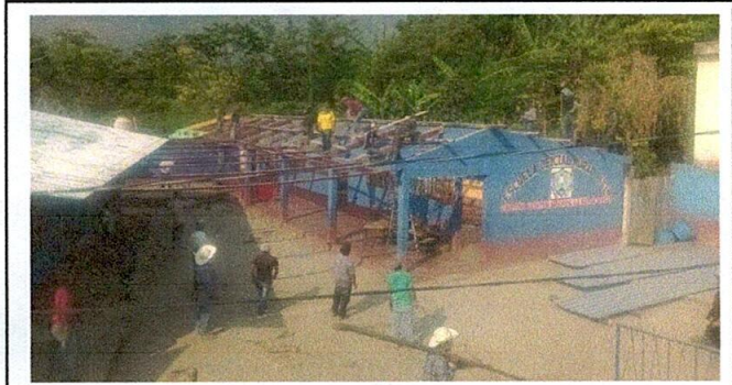
Foto 1: PADRES DE FAMILIA DESMONTANDO LA LAMINA Y VIGAS DE LA ESCUELA.