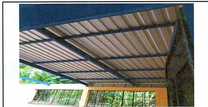
Foto 5: INSTALACIÓN DE LÁMINA TROQUELADA EN EL TECHO DE LAS AULAS.