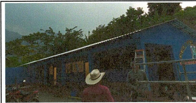
Foto 6: INSTALACIÓN DE LÁMINA TROQUELADA EN EL TECHO DE LAS AULAS.

Observación: Si es necesario se pueden agregar hojas adicionales y actualizar el número de hojas.