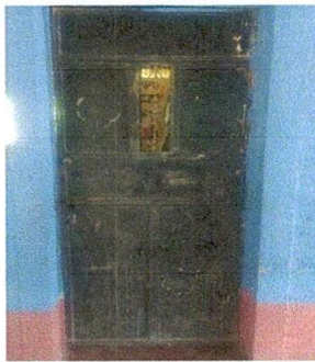
Foto 3: LA PINTURA DE LAS PUERTAS DE LAS AULAS, DIRECCIÓN Y COCINA YA ESTÁ MUY DETERIORADA.