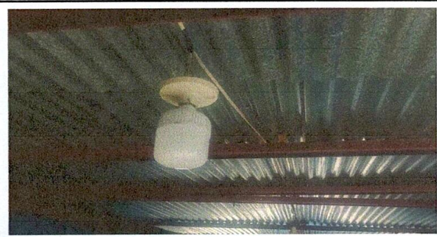
Foto 6: LA INSTALACÓN ELÉCTRICA DE LA ESCUELA YA SE ENCUENTRA EN MUY MALAS CONDICIONES.

Observación: Si es necesario se pueden agregar hojas adicionales y actualizar el número de hojas.