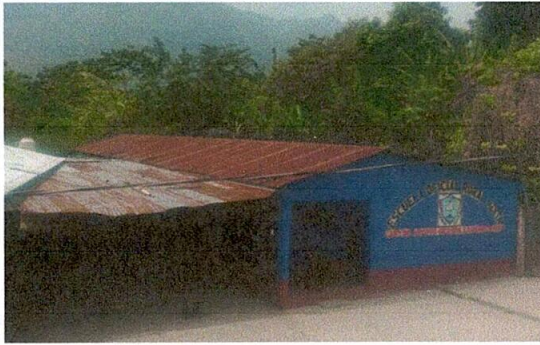
Foto1: LA LAMINA DEL TECHO DEL MODULO 1 DE LA ESCUELA YA SE ENCUENTA MUY OCCIDADA.