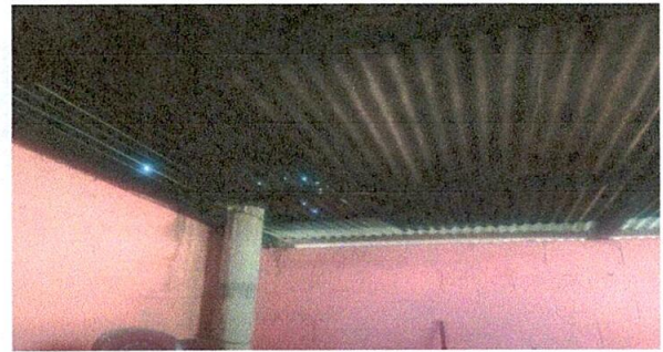
Foto 2: LA LAMINA DEL TECHO DE LA COCINA YA SE ENCUETRA MUY OCCIDADA Y CON AGUJEROS.