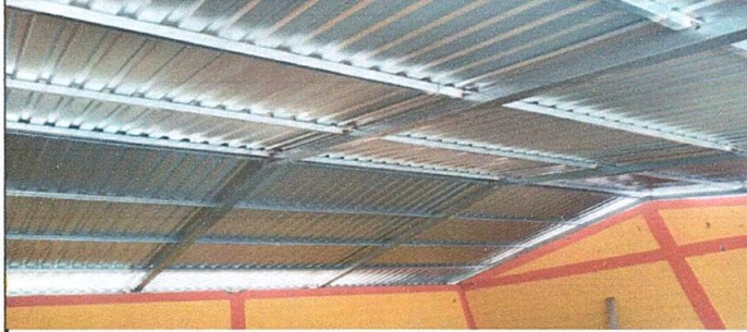
Modulo 3 posterior a la instalación