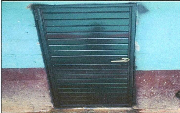
Puerta de baño posterior a la instalación