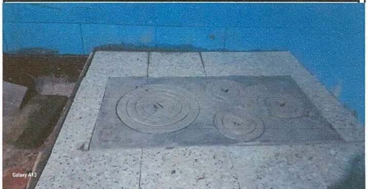
Plancha nueva de la cocina