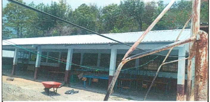
Módulo 2 posterior a la instalación