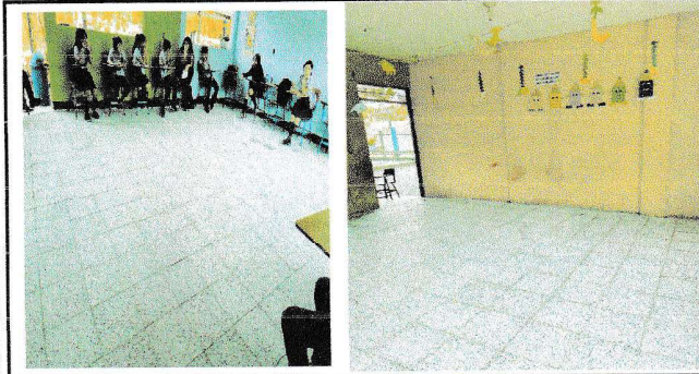
Foto1: Sustitución de torta de cemento por piso granito.