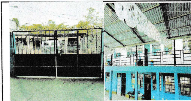
Foto 3: Sustitución de portón de ingreso y sustitución de malla por baranda de metal