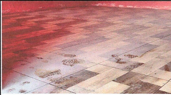
Foto1: Aula 1 piso finalizado.