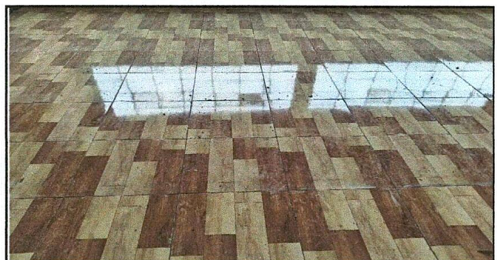
Foto 6: piso de cerámico ya instalado en lo que antes era piso de torta.

Observación: Si es necesario se pueden agregar hojas adicionales y actualizar el número de hojas.