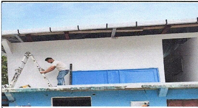
Foto 3: Sustitución de puerta de madera por metal, Repello de pared