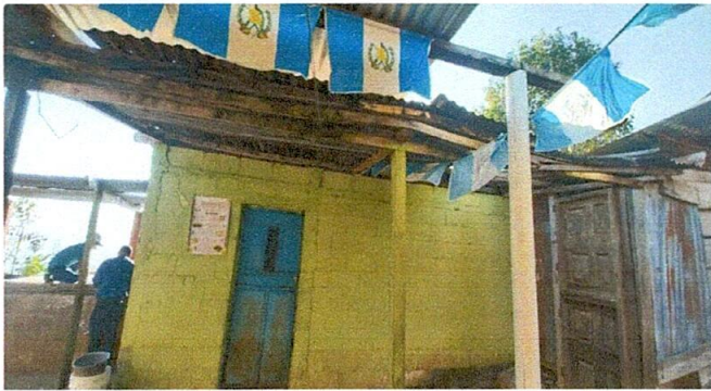
Foto 3: Sustitución de lámina, estructura de cocina y mantenimiento de puerta.