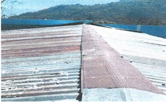
Foto1: Laminas en mal estado de la EORM Alde Cerro Grande