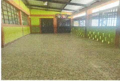
Foto1: Piso del corredor instalado en el 100%