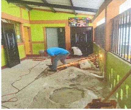
Foto1: Pegado de piso en el corredor