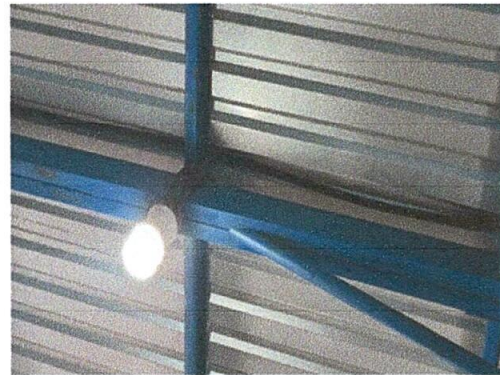
Foto 4: Sustitución de cableado eléctrico, porque se contaba con el riesgo de que un corto circuito proboque un incendio.