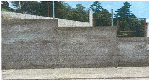
Foto 5: Se realizó reparación del muro de contención, debido a que por los años de haberse construido se había ido deteriorando, poniendo en peligro a los estudiantes del centro educativo.

Observación: Si es necesario se pueden agregar hojas adicionales y actualizar el número de hojas.