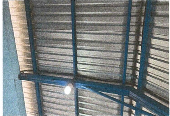
Foto 2: Se realizó sustitución de estructura de madera, por metal y reparación de sistema eléctrico, para evitar algún incendio en las instalaciones del centro educativo.