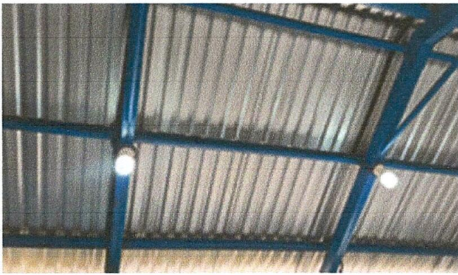
Foto 3: Sustitución de lámparas LED, ya que habían varias que se encontraban dañadas o quebradas.