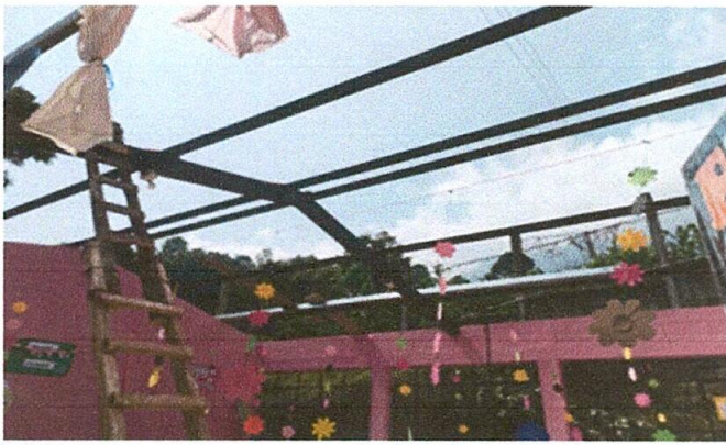
Foto 1: Se inició con la sustitución de estructura de madera, por metal y reparación de sistema eléctrico, para evitar algún incendio en las instalaciones del centro educativo.