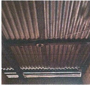
Foto 3: Sustitución de lámparas LED, ya que hay varias que se encuentran dañadas o quebradas.