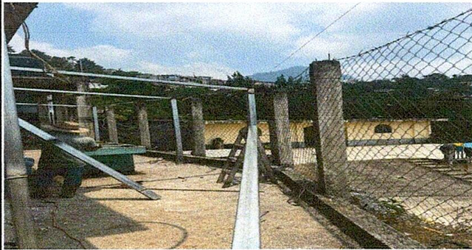
Foto1: Colocación de techo