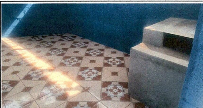
Foto 5: sustitución de piso de concreto a piso antideslizante en módulo de cocina