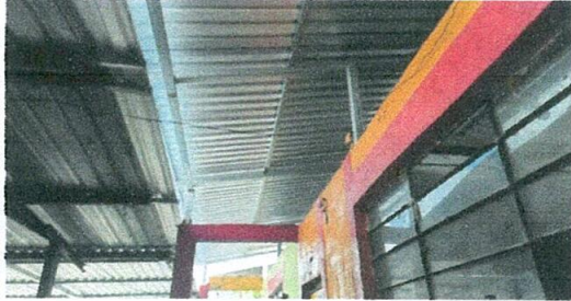
Foto1: Cambio de lámina de aulas terminado.