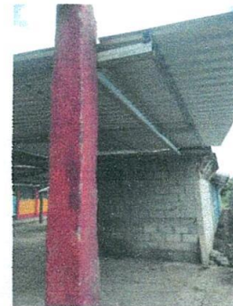
Foto 4: Cambio de estructura de madera por metal, del lado izquierdo del salón terminado.