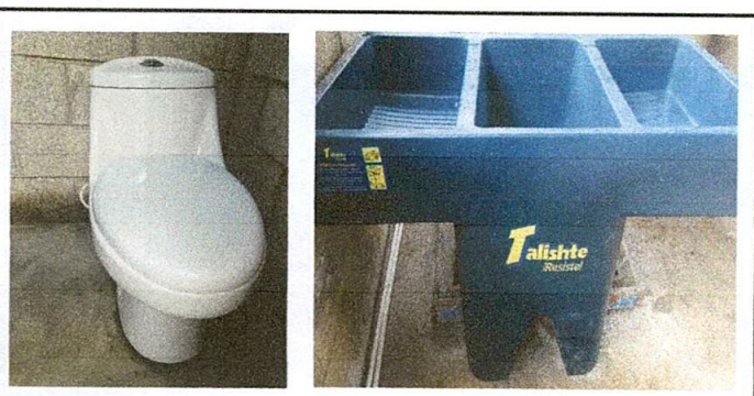
Foto 5: Sustitución de inodoros y pila plástica de dos lavaderos terminado.