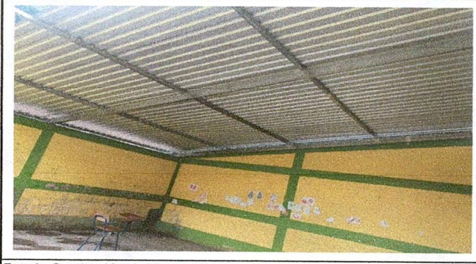
Foto1: Sustitución de lámina de aulas terminado.