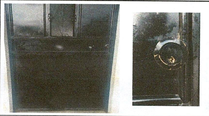
Foto 3: Mantenimiento a estructuras de puertas de metal de lijado, cepillado, aplicación de pintura y cambio de chapas terminado.