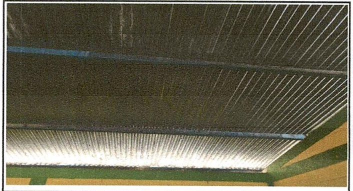
Foto 2: Situación actual de las costaneras deterioradas con el pasar de los años.