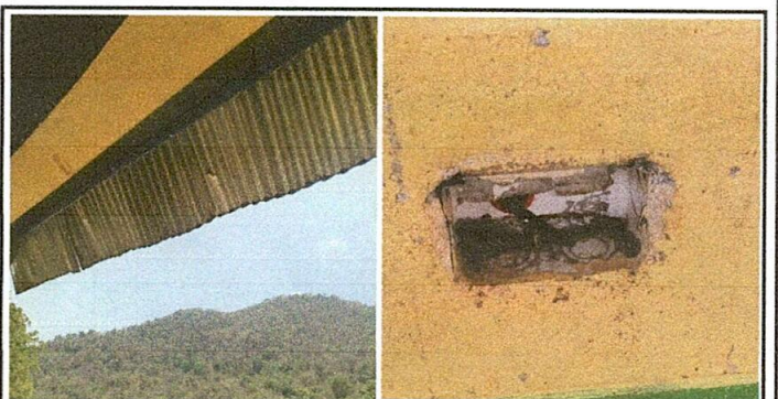
Foto 6: Bajada de agua pluvial en mal estado se han caído los tubos y están rotos. De igual manera tomacorrientes eléctricos en mal estado

Observación: Si es necesario se pueden agregar hojas adicionales y actualizar el número de hojas.