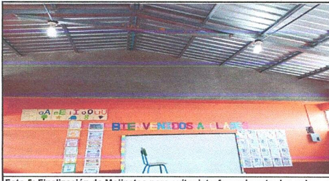
Foto 5: Finalización de Mojinetes para evitar interferencia entre las aulas.