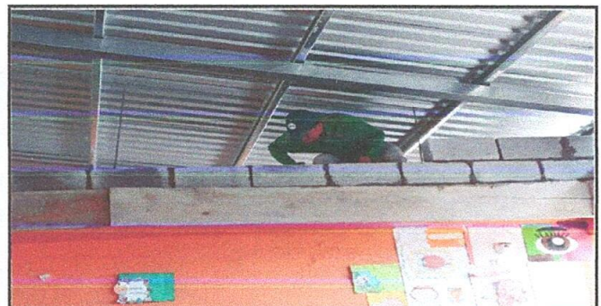
Foto 6: Levantado de mojinetes para evitar interferencia entre las aulas techadas.

Observación: Si es necesario se pueden agregar hojas adicionales y actualizar el número de hojas.