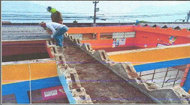
Foto1: Quitado de teja canaleta, que por el tiempo ya tenía mucho agujero y en invierno filtraba agua.