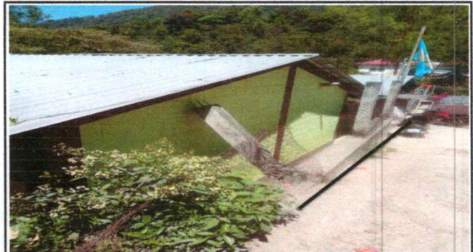
Foto 4: Reparación de muro perimetral de block con tubo hg y malla galvanizada, soleras intermedias y columnas.