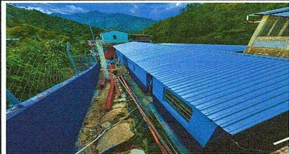
Foto 2. Cambio de techo con estructura de metal