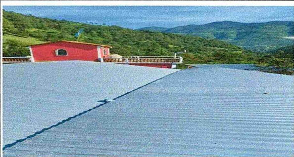
Foto 1. cambio de lámina