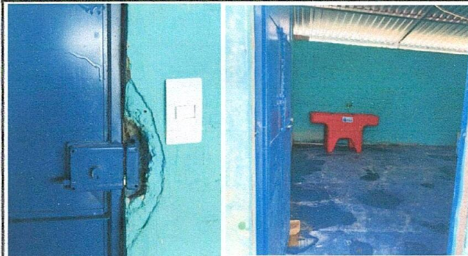
Mantenimiento de puertas metálicas