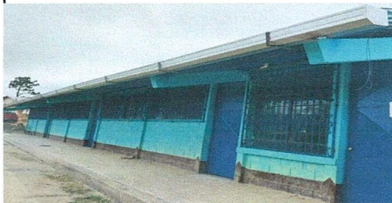
Mantenimiento de estructura de soporte de metal