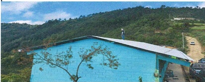
Sustitución de lámina, por lámina troquelada calibre 26