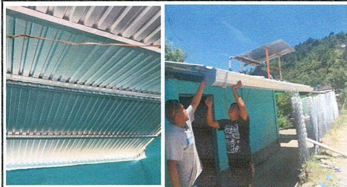
Sustitución de estructura de soporte de madera, por metal