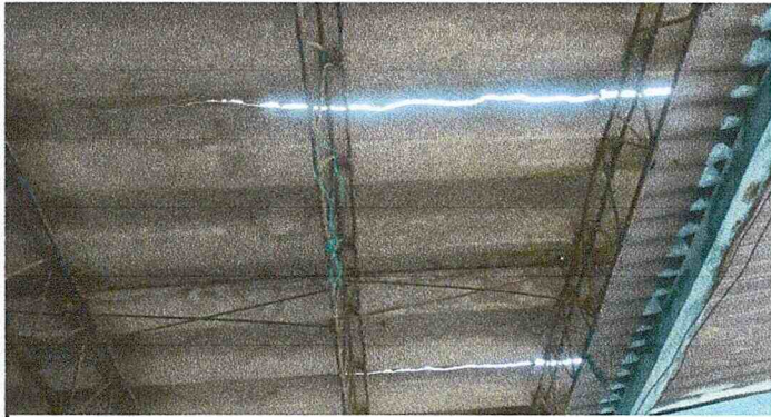
Foto 3: Techo de fibrocemento agrietado por lluvias y soporte de metal tipo joist oxidado en mal estado en la mayor parte.