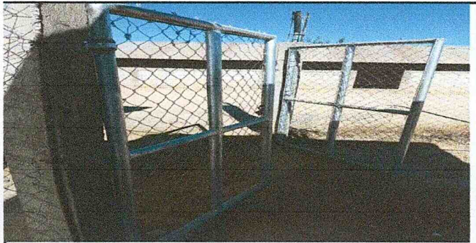
Foto 5: Portón de estructura metalica y maya en mal estado, difícil de abrir y cerrar.