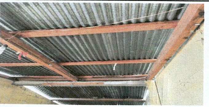
FOTO 5 Estructura de madera se sustituye por estructura de metal