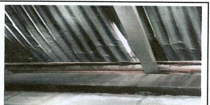
FOTO 6 Laminas clavadas con clavos de Lamina se sustituye con tornillos de lamina

Observación: Si es necesario se pueden agregar hojas adicionales y actualizar el número de hojas.