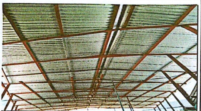
Foto 4: Sustitución de lámina acanalada por lámina troquelada calibre 26