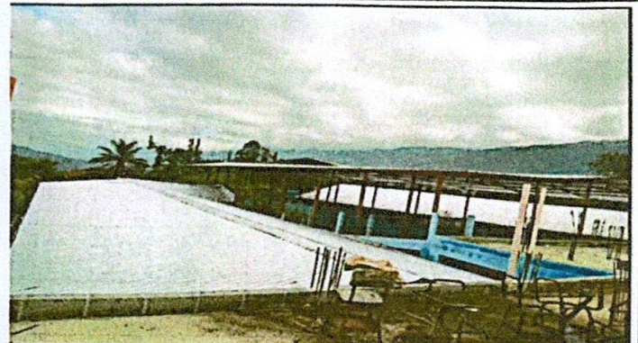
Foto 2: Sustitución de capote por capote para lámina troquelada calibre 26