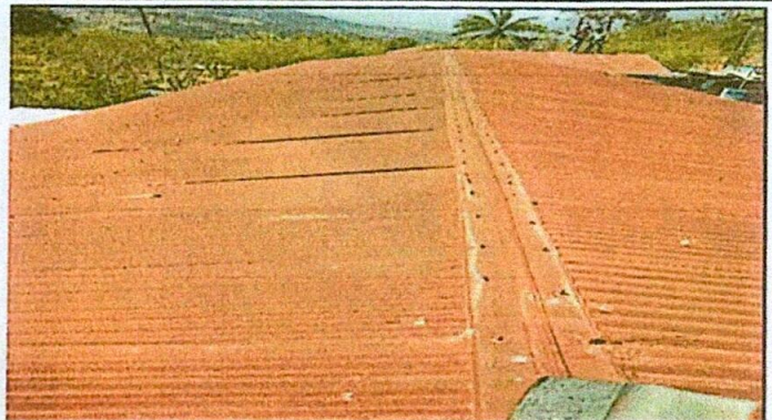
Foto 2: Sustitución de capote por capote para lámina troquelada calibre 26