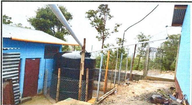
FOTO 3: instalado ya el deposito de agua de 10,000 litros, con tubos de captación de agua mejorando el servicio de agua.