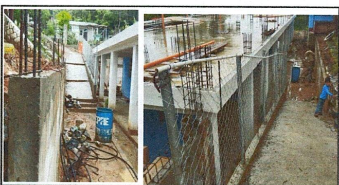
FOTO 5: muro de contención concluido, deteniendo así el deslave, que perjudiquen los salones de clase.