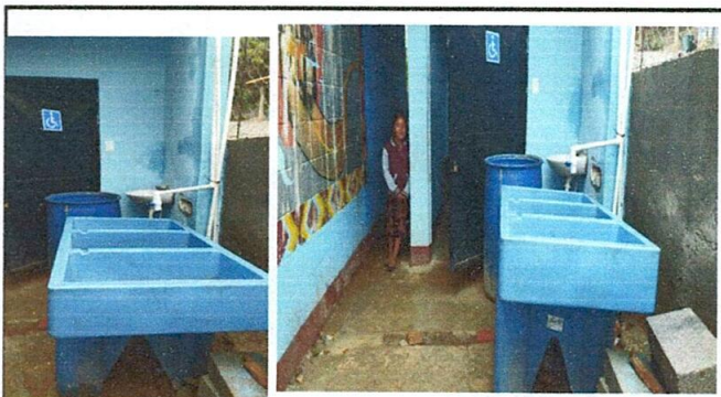
FOTO 4: las pilas ya instaladas en el espacio de baños, mejorando así el espacio de limpieza.