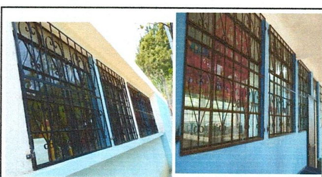
FOTO 6: balcones instalados en el area frontal y posterior de la dirección del establecimiento educativo,

Observación: Si es necesario se pueden agregar hojas adicionales y actualizar el número de hojas.