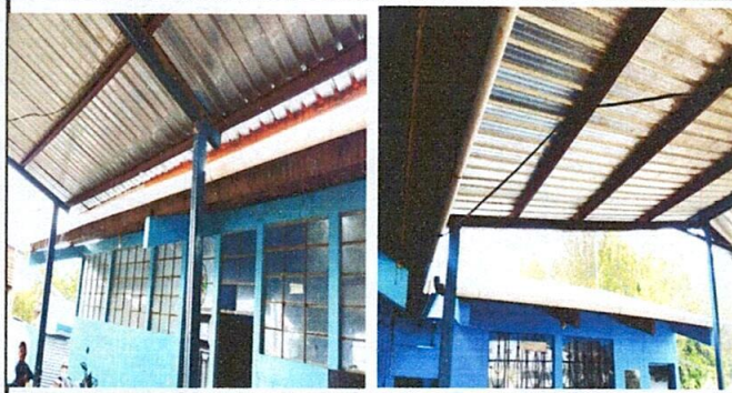
FOTO 1: reforzado el tubo para su mejor durabilidad en el proceso de recolección de agua de lluvia.