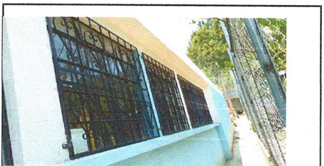
FOTO 6: en el lado de atrás, en lo que compete a dirección, se ha colocado balcón para el resguardo de documentos administrativos.

Observación: Si es necesario se pueden agregar hojas adicionales y actualizar el número de hojas.