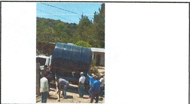
FOTO 3: con la llegada de un depósito de mayor capacidad, y ayuda de padres de familia, dará mejor y servicio a la población escolar