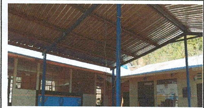
FOTO 1: en lo que va avanzando el proceso de remodelación, se han cambiado los tubos de captación de aguas de lluvia y poder aprovecharlos en su época.