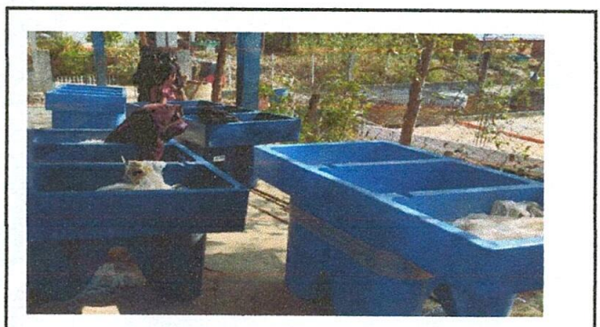
FOTO 4: con la llegada de pilas plásticas, se podrá contar con un espacio digno para lavar recipientes y captación de agua en distintos puntos de la escuela.