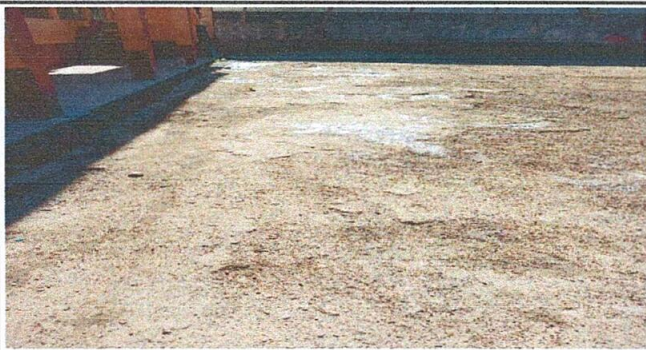
Foto 3: sustitución de piso de torta de concreto en el patio del establecimiento