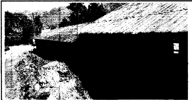
SUSTITUCIÓN DE MURO PERIMETRAL