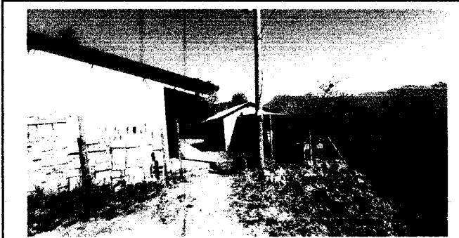
SUSTITUCIÓN DE MURO PERIMETRAL