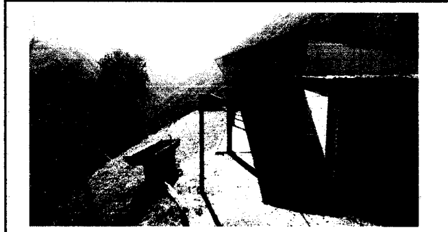
CONSTRUCCIÓN DE MURO PERIMETRAL