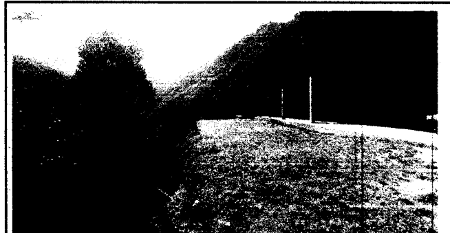
SUSTITUCIÓN DE MURO DE CONTENCIÓN