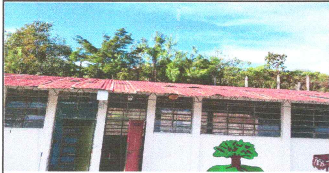
Foto1: Daño en techos de aulas