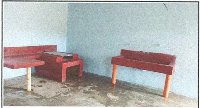
ENTREGA DE LAVATRASTOS