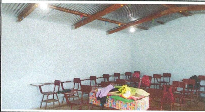
ENTREGA DE SALONES COMPLETOS