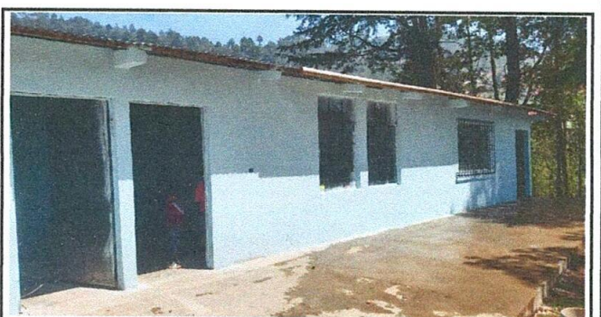
ENTREGA DE BANQUETAS

Observación: Si es necesario se pueden agregar hojas adicionales y actualizar el número de hojas.