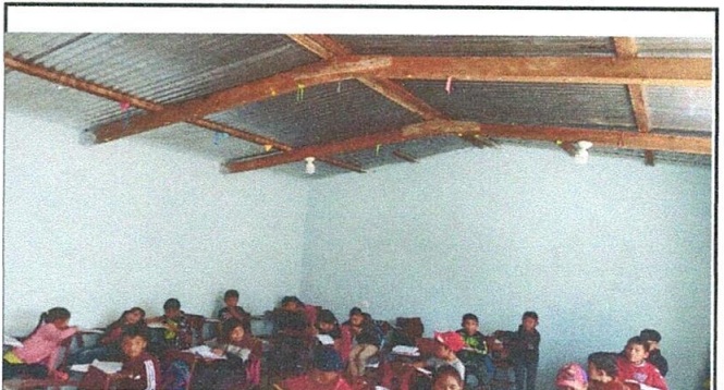
DURANTE EL REPELLO DE SALONES, PISO ALISADO