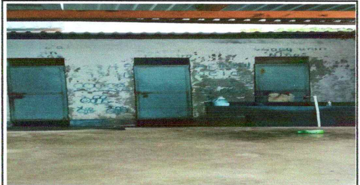
Foto 10: Puertas oxidadas en malas condiciones de los baños en pésimo estado, es necesario cambiarlos.