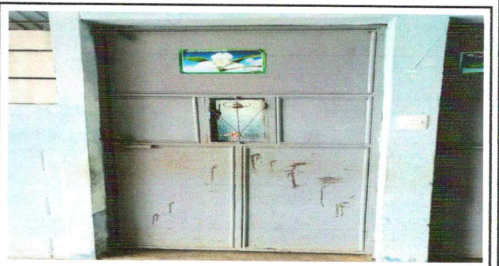
Foto 4: Puerta oxidada en malas condiciones de una de las aulas, es necesario reemplazarla,