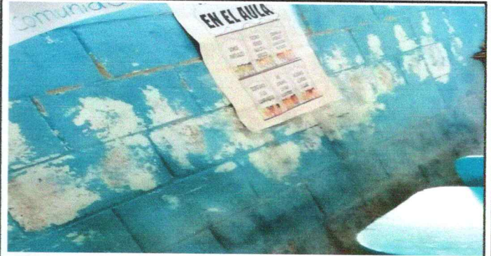
Foto 2: Aulas necesita pintura con un total de 590 metros incluyendo paredes de la cocina.