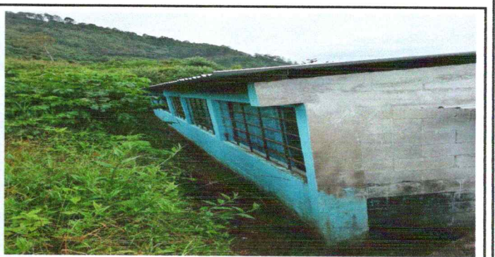
Foto 6: Ventanas en la parte de atrás de la escuela, necesitan balcones.

Observación: Si es necesario se pueden agregar hojas adicionales y actualizar el número de hojas.