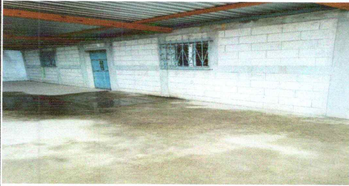
Foto1: Cocina necesita pintura