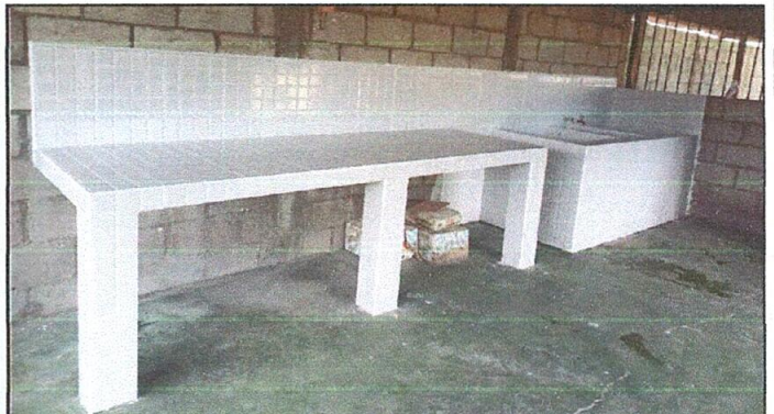
Foto 4: La pila y la mesa de concreto de la cocina del establecimiento han sido cubiertas de azulejo.