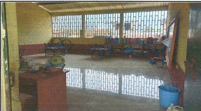
Foto 3: El piso de torta de cemento de las aulas ha sido sustituido por porcelanato de manera efectiva.