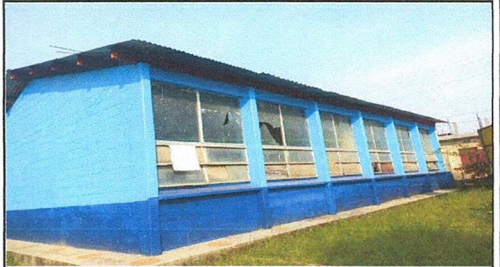
Foto 2: Se observa que el las 2 láminas del aula han sido sustituidas eficientemente.