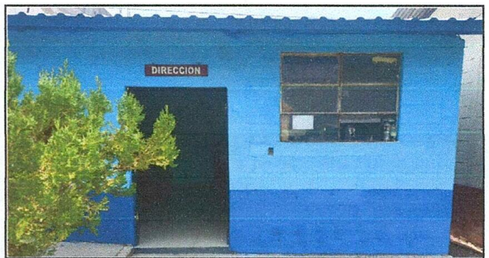
Foto 6: La estructura de madera del techo de la Dirección del establecimiento ha sido sustituida completamente por estructura portante de metal, así como las láminas y el piso de torta de concreto se cambio

Observación: Si es necesario se pueden agregar hojas adicionales y actualizar el número de hojas.