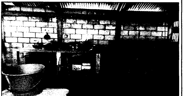
Foto 4: La cocina cuenta con mesa y pila de cemento, las cuales serán remodeladas con azulejo; para un mejor manejo saludable de los alimentos.