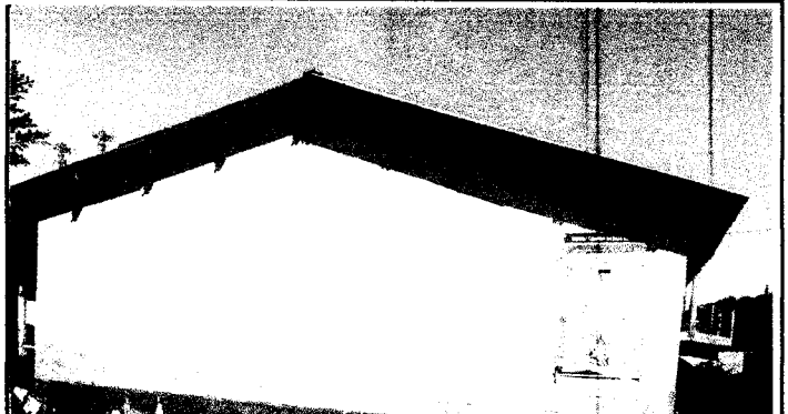
Foto 2: Las láminas del techo del aula que dan frente a la calle de la entrada principal de la escuela, se encuentran en mal estado; por lo que serán sustituidas.