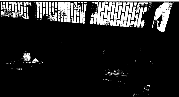
Foto 3: Puede observarse que el piso es torta de cemento, la cual será sustituida por azulejo en dos aulas.