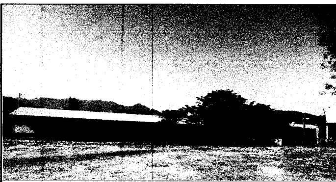
Foto 5: Módulo de aulas que serán pintadas en los muros exteriores, para una mejor ornamentación en el establecimiento.