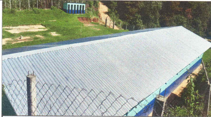
Foto1: Sustitución de lámina