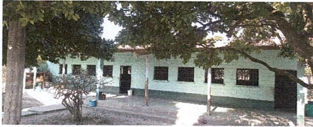
Foto 1: estas dos aulas pertenecen al módulo I y se necesitan 60 láminas troqueladas calibre 26.