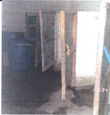
Foto 3: Puertas de los sanitarios que se quieren sustituir por 10 puertas de metal.