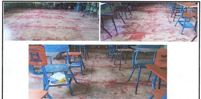
Foto 6: foto de las 3 aulas que pertenecen al módulo III los cuales se quieren sustituir por piso cerámico antideslizante.

Observación: Si es necesario se pueden agregar hojas adicionales y actualizar el número de hojas.