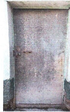
Foto 2: La puerta de la cocina que se necesita ser sustituida por una puerta de metal.