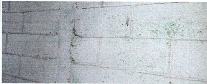
Foto 5: pared de los sanitarios que se quieren repellar, para lo cual se usará arena y cemento.