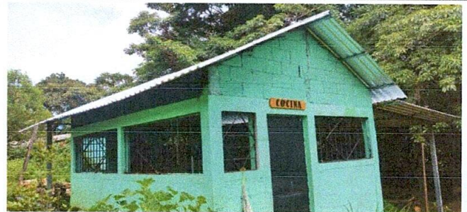
Foto 6: Sustitución de estructura de madera por estructura de metal y lamina troquelada calibre 26

Observación: Si es necesario se pueden agregar hojas adicionales y actualizar el número de hojas.