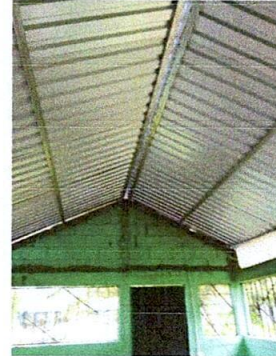
Foto 4: Sustitución de estructura de madera por estructura de metal y lamina troquelada calibre 26