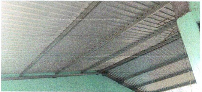
Foto1: Sustitución de estructura de madera por estructura de metal y lámina troquelada calibre 26