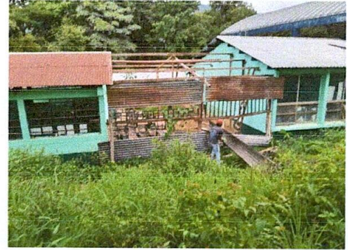
Foto 2: Sustitución de estructura de madera por estructura de metal y lamina troquelada calibre 26