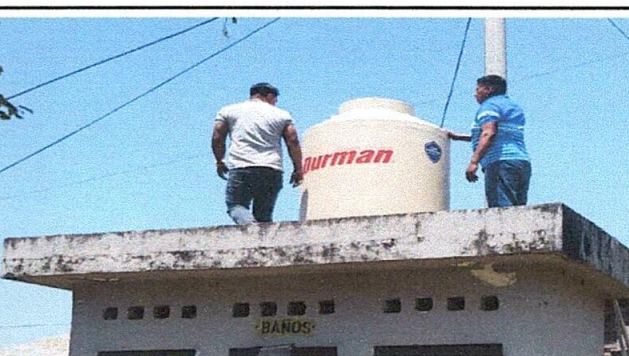
Foto 6: Sustitución de depósito de almacenamiento de agua de 1,100 litros

Observación: Si es necesario se pueden agregar hojas adicionales y actualizar el documento de hojas.