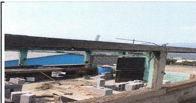
Foto 3: Mejoramiento de pared de block para colocación de estructura de soporte y lamina