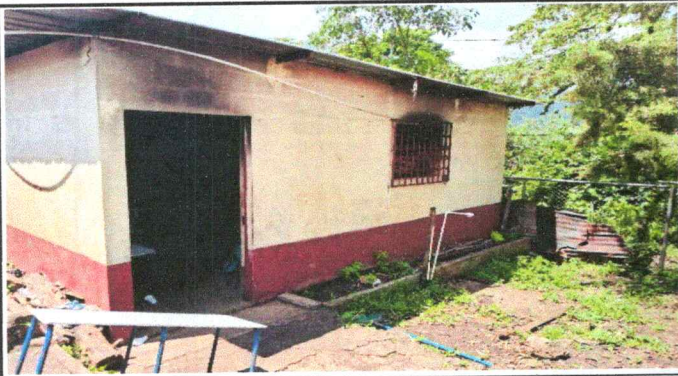
Foto1: CUBIERTA DE LAMINA PARA COCINA