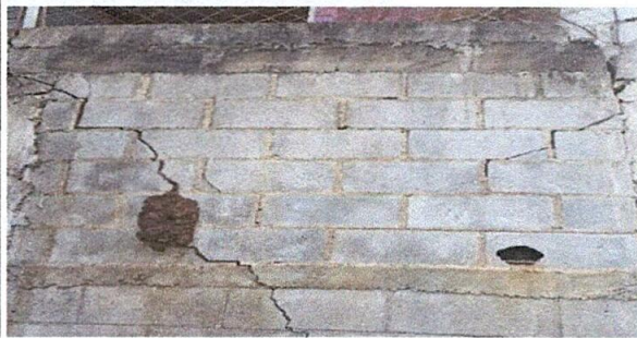
Foto1: Reparación de muro de contención/ Reparación de muro perimetral de block con tubo HG y malla galvanizada, soleras intermedias y columnas.