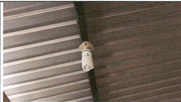
Foto 4: Sustitución de focos ahorradores y reparación de cableado